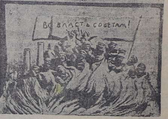
К 10-й годовщине Октября Госиздат выпускает юбилейные плакаты. На снимке плакат: «Вся власть советам», изображающий скульптуру художника Иннокентия Жукова.