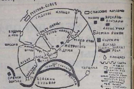
СХЕМА уличных боев в МОСКВЕ.

Обзор октябрьских событий 1917 года в Москве