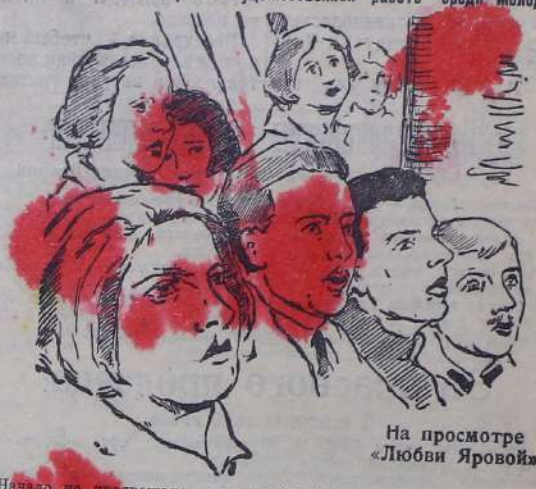
На просмотре «Любови Яровой»

Театр далек от молодежи «Надо снизить цены на билеты» С совещания по театрально-художественной работе среди молодежи